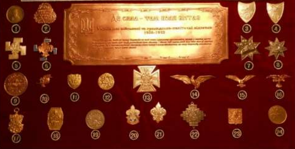
Відзнаки українських товариств «Сокіл», «Січ», «Пласт»