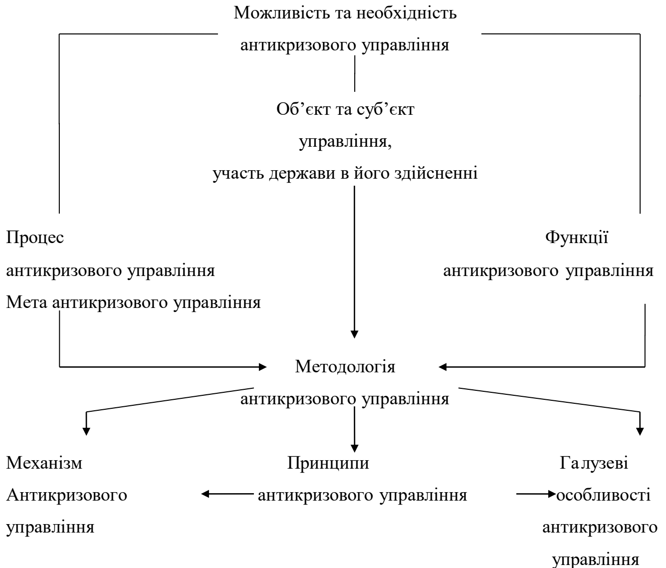
Рис.1.1. Концепція системи антикризового управління підприємством [15,16].

Взаємозв'язок між базовими положеннями системи антикризового управління поданий на рис.1.1.