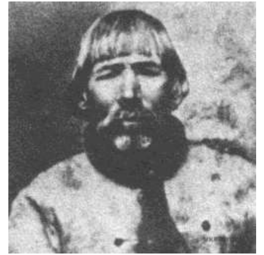
Батько Василя Стефаника

Василь Стефаник переїхав до Дрогобича і вступив до місцевої гімназії, яку закінчив 1892 р. Того ж року він вступив на медичний факультет Краківського університету, де вчився до 1900 р. Університет покинув, бо медицина його не цікавила.